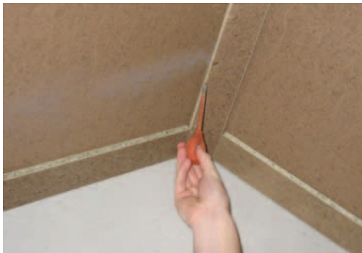
Onderzoek luchtlekages met rook.

Geluid plant zich door lucht eenvoudiger voort dan door lagen die in samenstelling verschillen. Het is ook de grond-