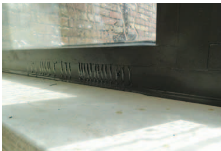
Luchttek is waterlek.

slag voor ultrasone controle op luchtlekken van details. Voor gebouwen in een drukke omgeving, zoals nabij een snelweg of een school, zeker een punt van aandacht.